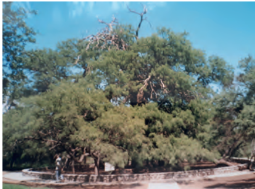
Árbol más antiguo de San Luis- Algarrobo Abuelo 1000 años

Al inicio de la década de 1990 la Provincia de San Juan buscó su árbol más antiguo y encontró un ejemplar de Algarrobo Negro con una antigüedad de 450 años, cerca de la localidad de Jachal al norte provincial. San Luis tiene a su Algarrobo Abuelo de 1000 años en Merlo, Villa Mercedes logró destacar un Ombú de 600 años cuyo perímetro del tronco tomado a un metro de altura arrojó 23 metros. En Lavalle, Mendoza se encuentra un Algarrobo Histórico, protegido en el Museo Histórico Natural de ese Departamento, y data de más de 300 años. Chile ubicó un Alerce de 3000 años, España 2000 años, EEUU una conífera de 3200 años y el más antiguo del mundo a la fecha está en Suecia, un Abeto que tiene una antigüedad estimada en 9500 años.