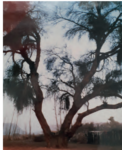
Árbol más antiguo de San Juan- Algarrobo Negro 450 años

Cada región del planeta tiene características propias que hacen únicos a los ejemplares que se redescubrieron. Cuando San Juan realizó el concurso encontró árboles que actualmente son puntos turísticos que merecen ser visitados. A parte del Algarrobo Negro de 450 años mencionado, ubicaron en segundo lugar, un Olivo de 350 años que se haya en una cañada cerca de Valle Fértil, tercer lugar para una Parra de 200 años que se encuentra frente a la Plaza de los Poetas en el Zonda y luego Agüaribais, Alamos y otras variedades que hasta ese momento estaban ocultas y desprotegidas y ahora forman parte de un registro de cuidado de ejemplares especiales.