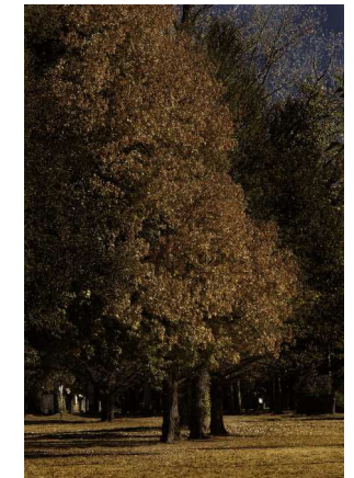
Fotos de árboles de la zona de San Rafael