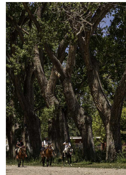
Fotos de árboles de la zona de San Rafael